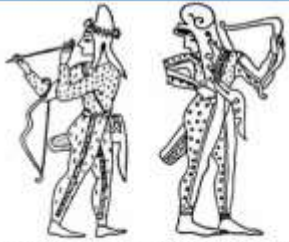
Анализ на древней вазе Гр. раскраски и фрески. Из Восточной Восточной Азии, чтобы приблизить — это скифские женщины, в софитной полемике убого и хитроумной скифской женой — страно ивуд, олово ивуд

коне-ство, охота - м/ж кибитки, еда- мясо. сыр, одежда -? молоко дом. кузн., кожев., дер. жен. ткач., вышив., гонч оружие -? → Гр. Матр.-!