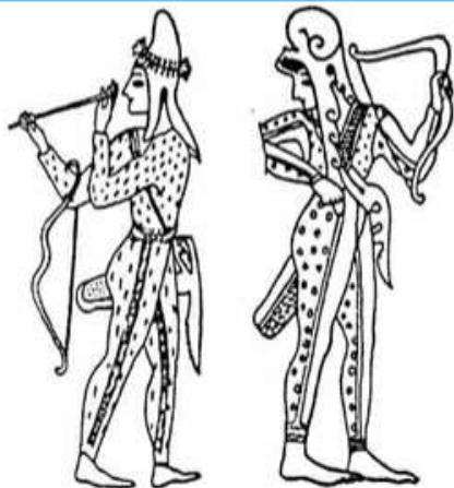
Амазонки на греческой вазе V в. романтичны и грациозны. Но достаточно быстрого взгляда, чтобы определить — это скифские женщины, в скифских головных уборах в характерной «скифской позе» — ступни вперед, головы назад

коне-ство, охота - м/ж кибитки, еда- мясо. сыр, одежда -? молоко дом. кузн., кожев., дер. жен. ткач., вышив., гонч оружие -? → Гр. Матр.-!